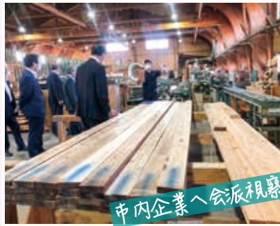
市内企業へ会派視察

10月14日▶長岡空襲の史実と平和の尊さを伝える出前授業「平和学習」。小学生と共に平和について考えた。