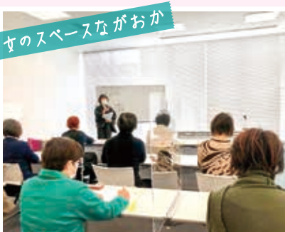
女のスペースながおか

12月28日▶12月定例会後半から産前産後休業し、男児を出産。妊娠・出産の経験を3月議会の一般質問に生かした。