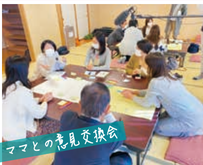
ママとの意見交換会

11月22日▶女性議員の会「雪樺の会」にて花角英世県知事へ要望書を提出。内容は子育てや教育、産業振興について。