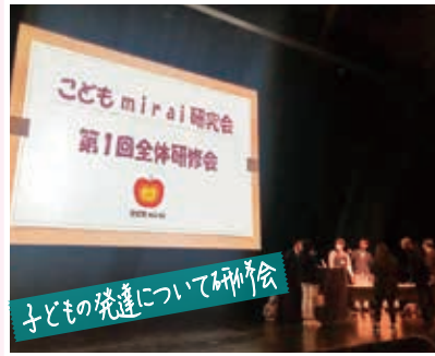
子どもの発達について研究会

10月14日▶所属会派「市民クラブ」市内研修で株式会社志田材木店様へ。ウッドショックの影響など伺う。