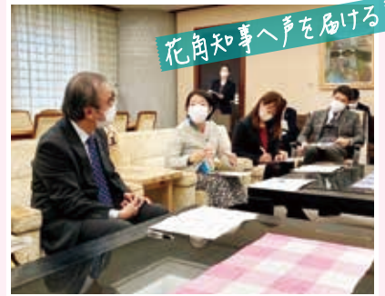
花角知事へ声を届ける

11月20日▶子どもの発達について支援者、専門家同士で情報共有を行う「こどもmirai研究会」の研修会に参加。