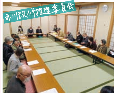
赤川河川浄化推進委員会

12月10日▶コミュニティ食堂「しろまる食堂」でハヤシライス作り。地域の実状や子育てについてお話を伺った。