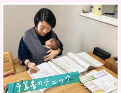
予算書のチェック

2月20日▶千手コミセンにて市政報告会を実施。日々の活動や議会での発言、令和4年度当初予算について報告した。