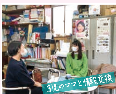
3児のママと情報交換

2月6日▶DV、虐待などの相談・支援を行う特定非営利活動法人「女のスペースながおか」の定期総会に参加。