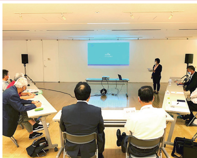
9月24日▶所属会派市民クラブで行う地域ミーティング。中学校区ごとに意見交換を行っています