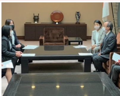
12月25日▶保守系女性議員で構成する「雪椿の会」で、花角英世新潟県知事に令和3年度の予算要望書を提出