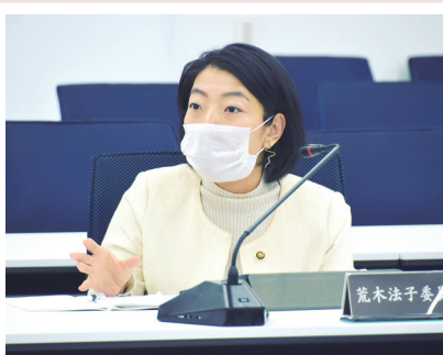
10月29日▶人口減少対策特別委員協議会。地域おこし協力隊の皆さんと意見交換し、Uターン促進を検討