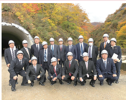
10月26日▶市民クラブで八十里越工事の進捗と只見町河井継之助記念館を視察。広域観光の可能性を探りました