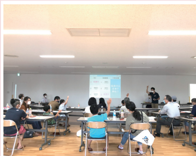
8月22日▶千手コミュニティセンターにて西千手の防災イベント。ハザードマップや大雨洪水時の避難について研修