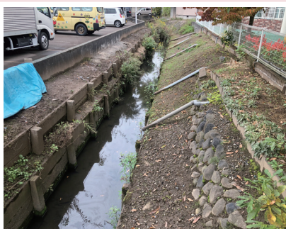
11月2日▶都市下水路「赤川」の測量調査や、南町公園の防犯性向上に向けた公園工事に際して現地を確認