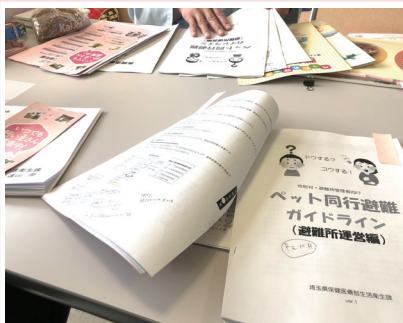
11月25日▶新潟県動物愛護センターにて災害時のペット同行避難についての今後の取り組みを確認