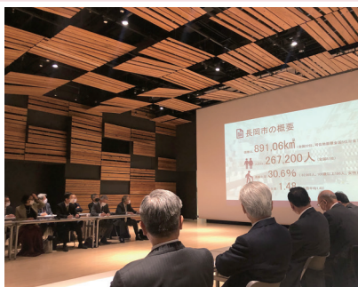
12月10日▶市民クラブと地域委員さんとの意見交換会。市内10支所地域の活動や課題を伺いました