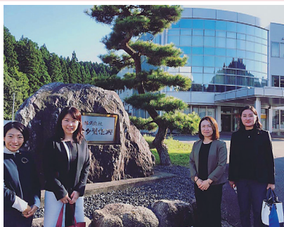
10月6日▶ワークライフバランスと育児休業についてお話を伺いに、市議仲間と与板「サカタ製作所」へ