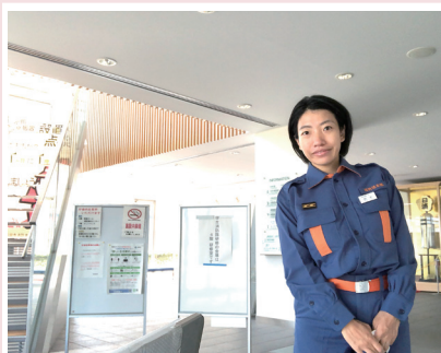
10月11日▶広報指導分団の活動で長岡市の防災対策と災害対応について市・危機管理防災本部より受講